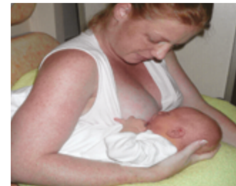
Position ballon de rugby

Choisissez la position qui vous convient le mieux, qui soit confortable pour vous et votre bébé. Bébé tout contre vous, bien soutenu, son ventre contre votre ventre. Son oreille, son épaule et sa hanche sont sur un même axe.