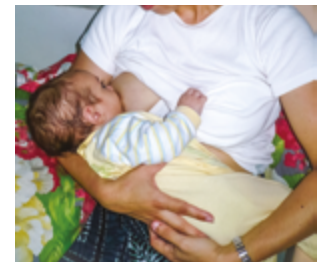
Position de la madone

Une position reconnue scientifiquement appelée « position BN » est adoptée par les mères de manière spontanée. Installée en position semi-inclinée en « bain de soleil », votre corps complètement détendu deviendra le nid douillet dans lequel votre bébé viendra se blottir. Tout son corps est soutenu par le vôtre. C'est ainsi qu'il pourra naturellement développer ses compétences.