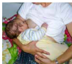
Position de la madone

Une position reconnue scientifiquement appelée « position BN » est adoptée par les mères de manière spontanée. Installée en position semi-inclinée en « bain de soleil », votre corps complètement détendu deviendra le nid douillet dans lequel votre bébé viendra se blottir. Tout son corps est soutenu par le vôtre. C'est ainsi qu'il pourra naturellement développer ses compétences.