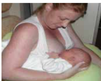
Position ballon de rugby

Choisissez la position qui vous convient le mieux, qui soit confortable pour vous et votre bébé. Bébé tout contre vous, bien soutenu, son ventre contre votre ventre. Son oreille, son épaule et sa hanche sont sur un même axe.